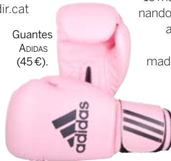
Guantes ADIDAS (45€).