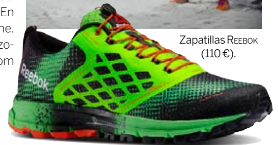
Zapatillas REEBOK (110€).