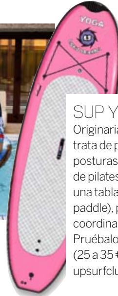
Tabla LIQUID SHREDDER (680 €).